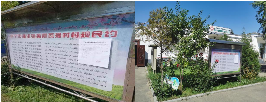
英阿瓦提村公告栏