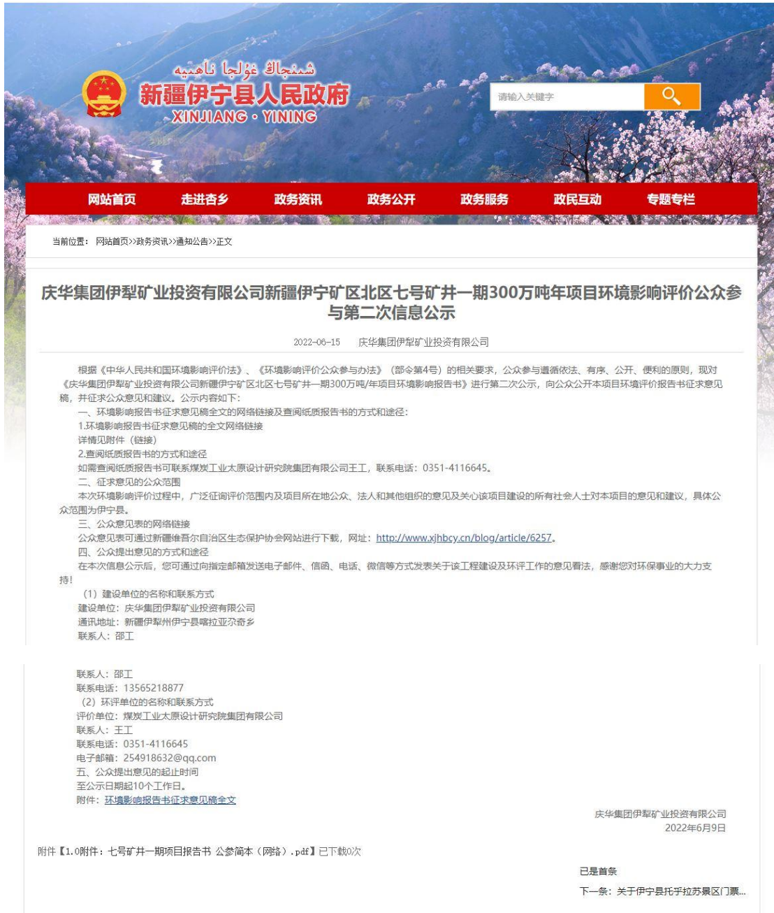
图 3.2-1 征求意见稿网上公示截图