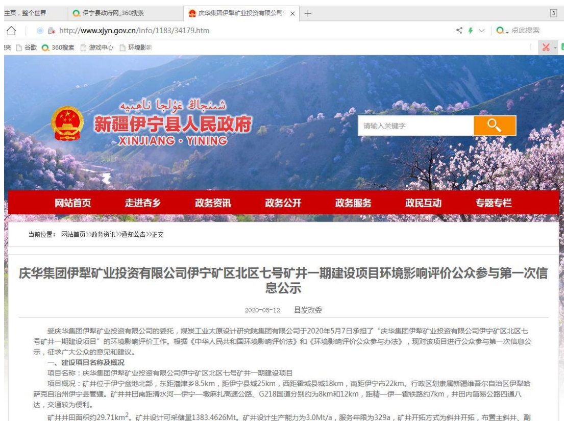
图 2.2-1 第一次公众参与网络公示截图

我公司于2020年5月12日在新疆伊宁县人民政府网（ http://www.xjyn.gov.cn/info/1183/34179.htm ）发布了《庆华集团伊犁矿业投资有限公司伊宁矿区北区七号矿井一期建设项目环境影响评价公众参与第一次信息公示》，自本公告发布之日起至环境影响报告书征求意见稿编制过程中，公众均可以自行下载公众意见表填写个人意见及建议，可以信函、电子邮件等方式，向建设单位或者环境影响报告书编制单位提交公众意见表。该网站是项目所在区域的政府网站，项目所在区域民众均可登录查阅，受众范围广，符合《办法》中规定要求。第一次公众参与网络公示截图详见图 2.2-1。