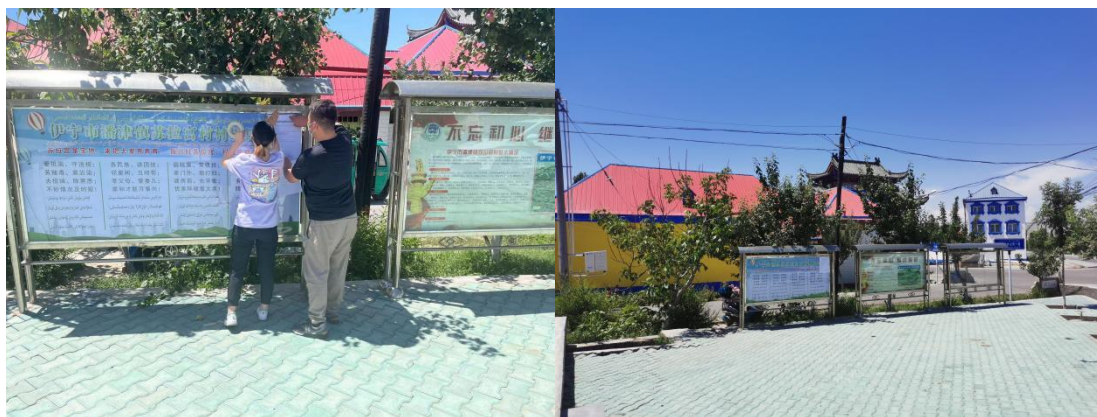
苏拉宫村公告栏 图 3.2-4 张贴公告公示截图