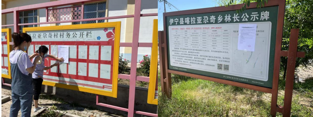
喀拉亚尕奇村公告栏

张贴地点选在喀拉亚尕奇乡的喀拉亚尕奇村和胡吉尔提村，潘津乡的苏拉宫村和英阿瓦提村公告栏。现场张贴时间为2022年6月15日，公示时限为自公示之日起10个工作日。征求意见稿环评信息现场张贴情况详见图3.2-4。