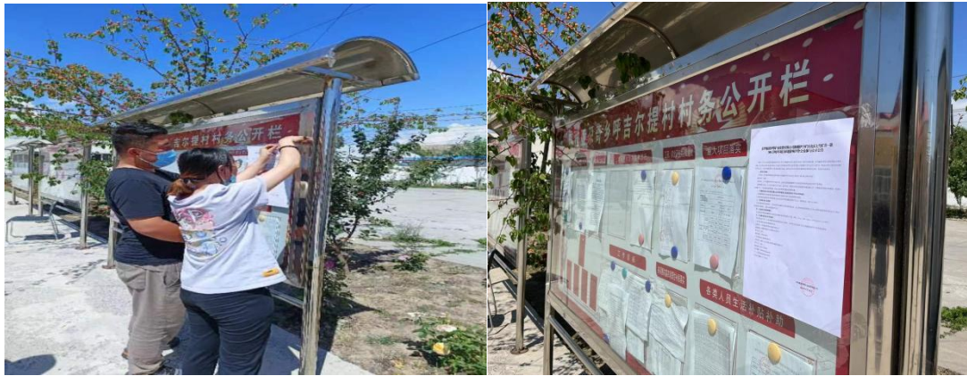
胡吉尔特村公告栏